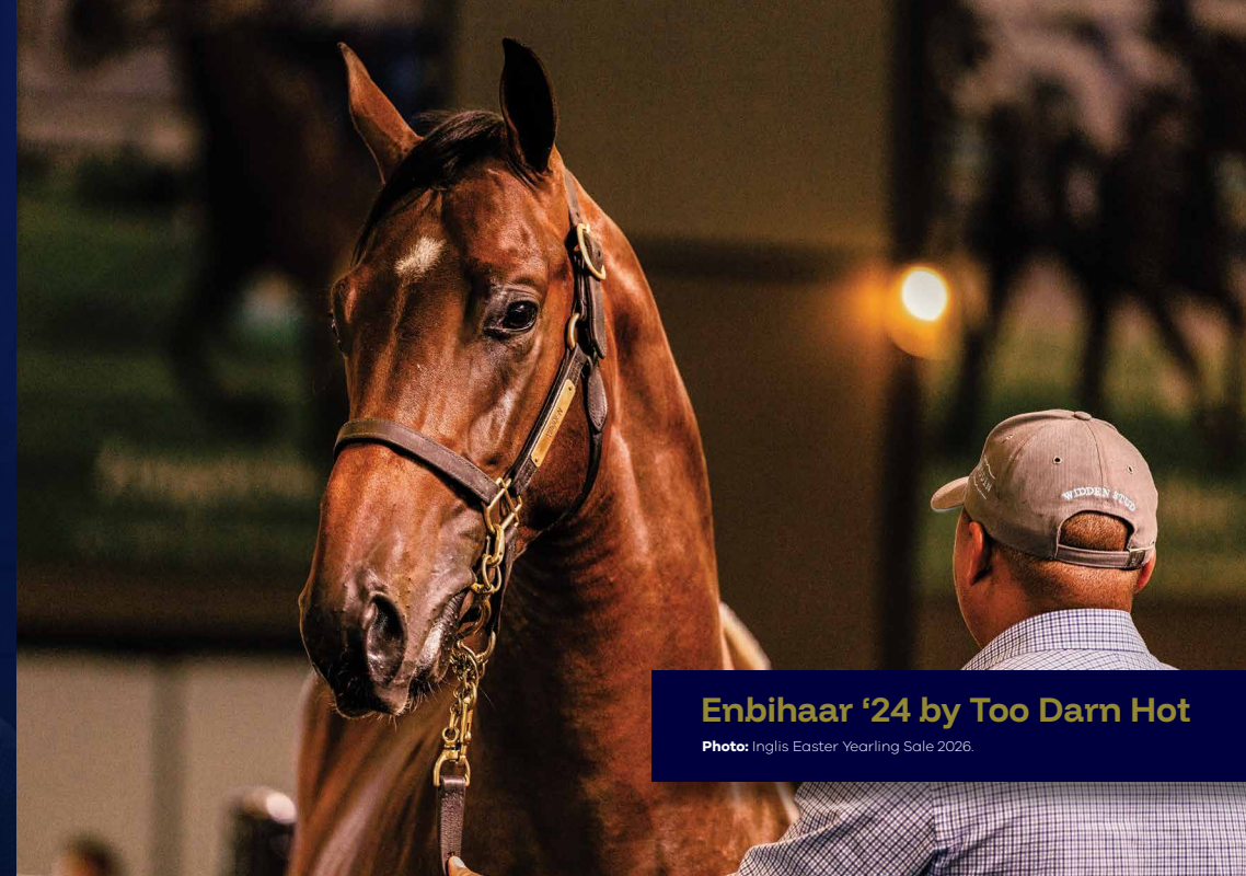
Enbihaar '24 by Too Darn Hot

Photo: Inglis Easter Yearling Sale 2026.