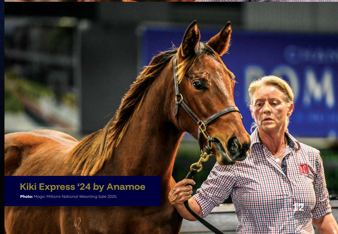
Kiki Express '24 by Anamoe

Photo: Inglis Easter Yearling Sale 2026.