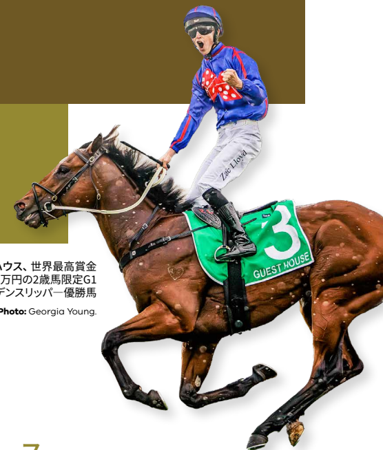
ゲストハウス、世界最高賞金5億7千万円の2歳馬限定G1ゴールデンスリッパー優勝馬